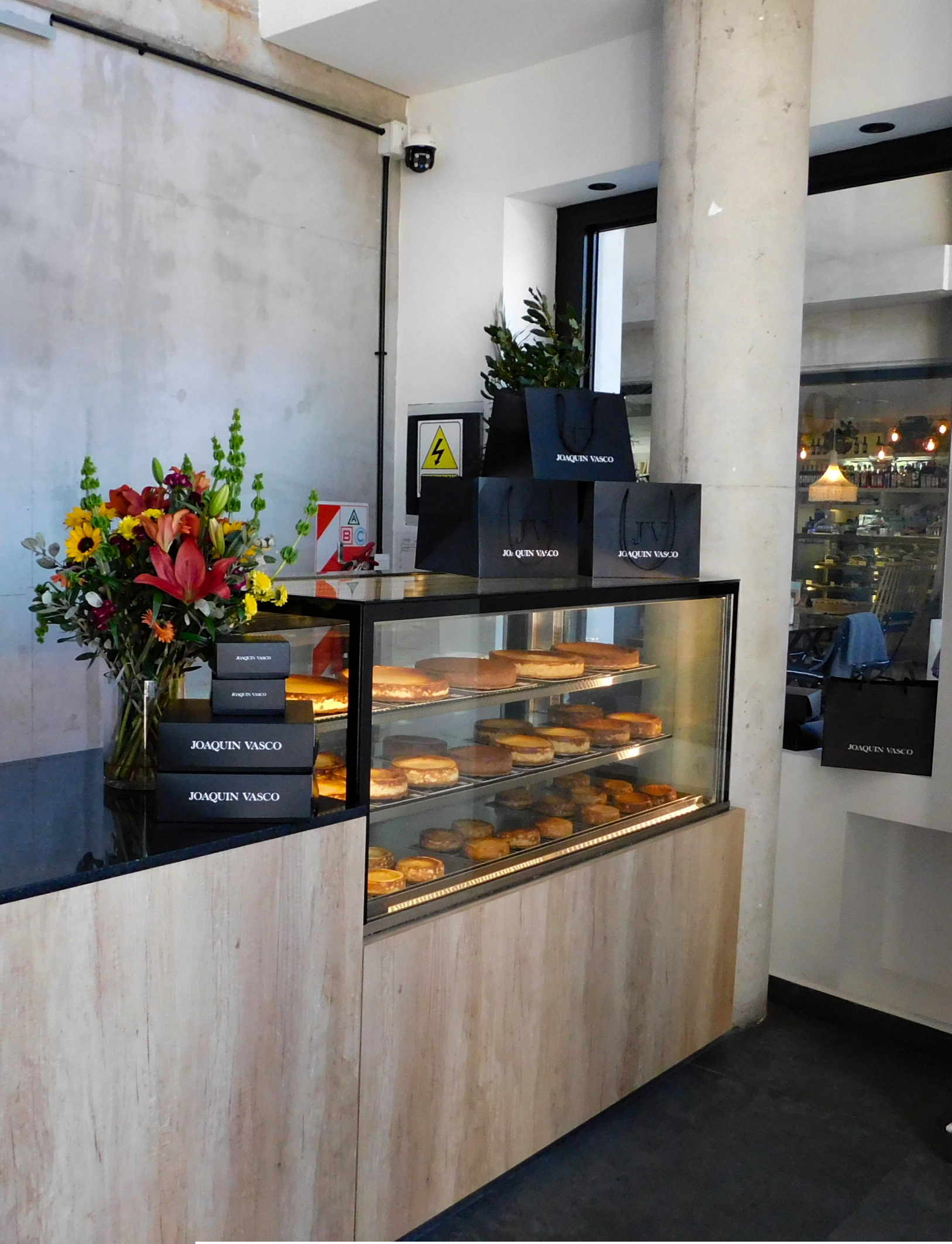
EQUIPRO | CATÁLOGO DE PRODUCTOS - HELADERAS COMERCIALES