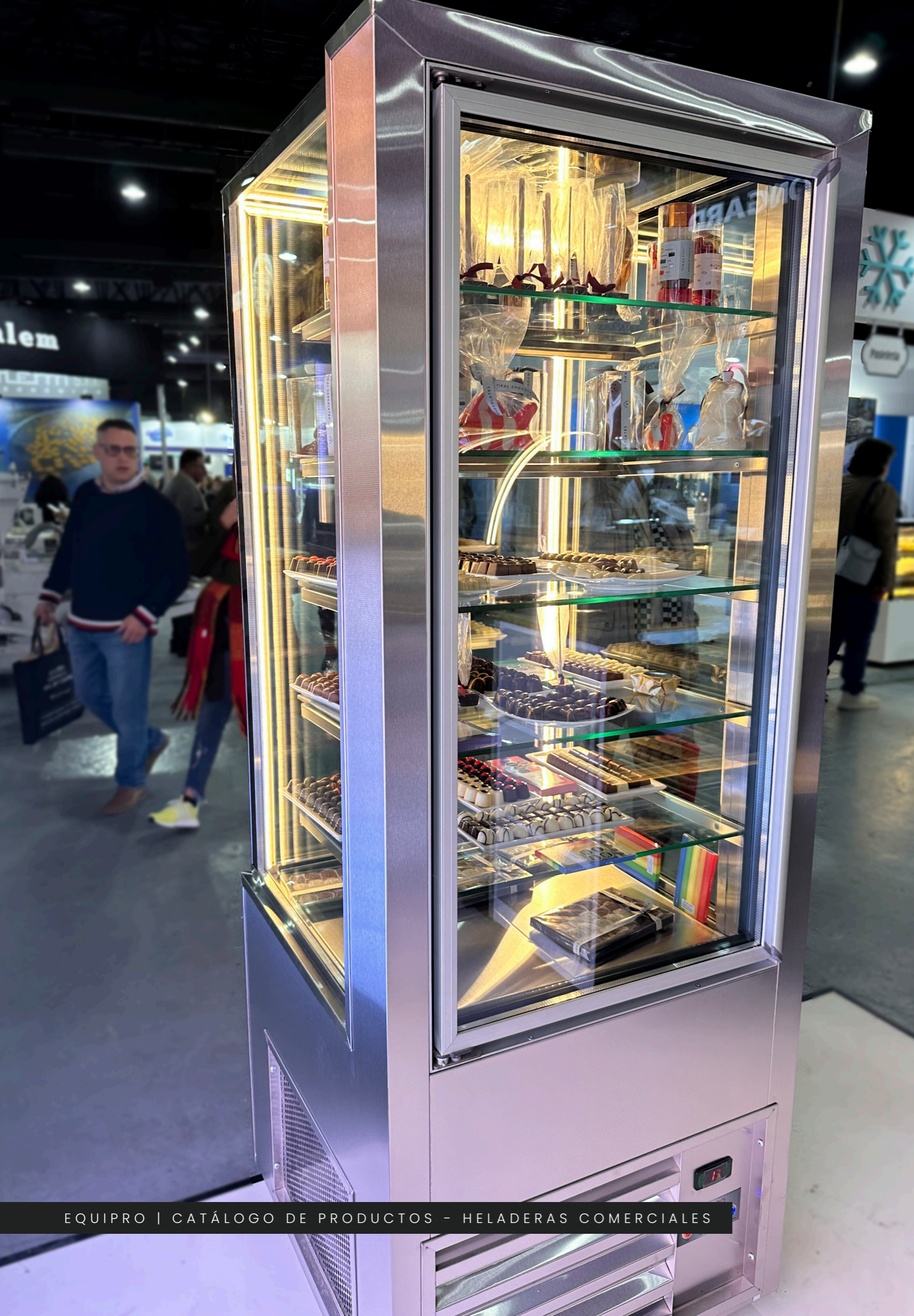
EQUIPRO | CATÁLOGO DE PRODUCTOS - HELADERAS COMERCIALES