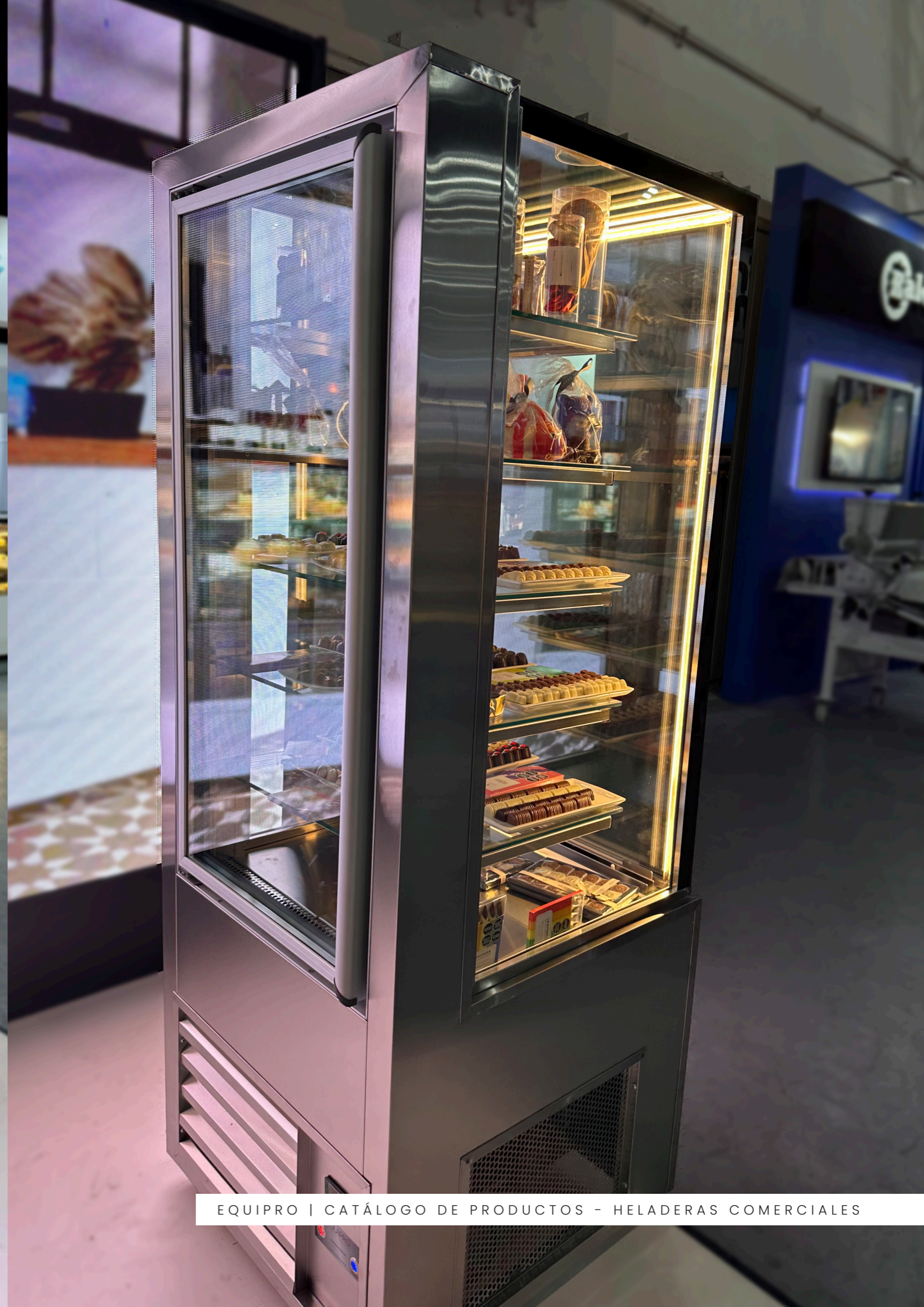
EQUIPRO | CATÁLOGO DE PRODUCTOS - HELADERAS COMERCIALES