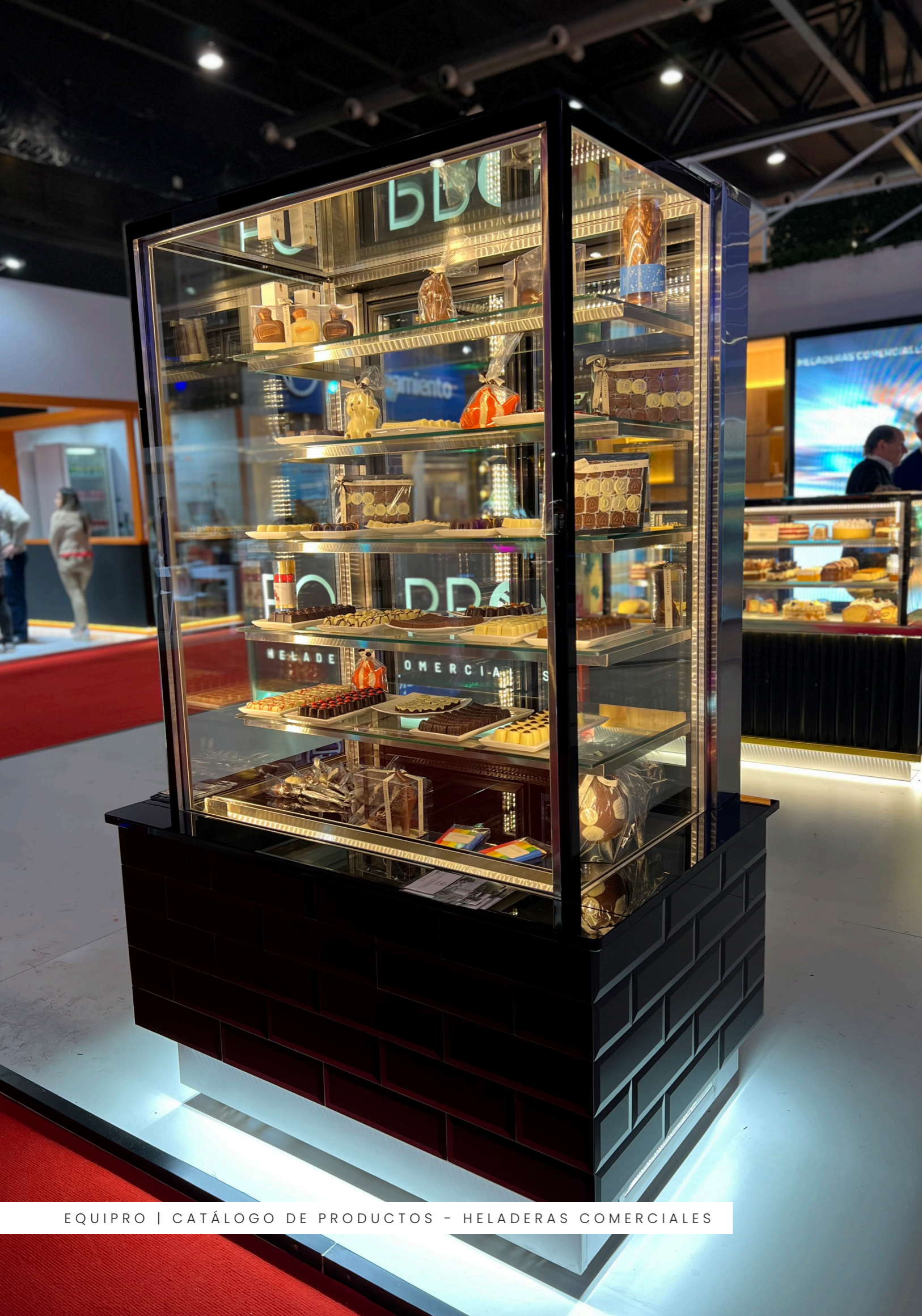
EQUIPRO | CATÁLOGO DE PRODUCTOS - HELADERAS COMERCIALES