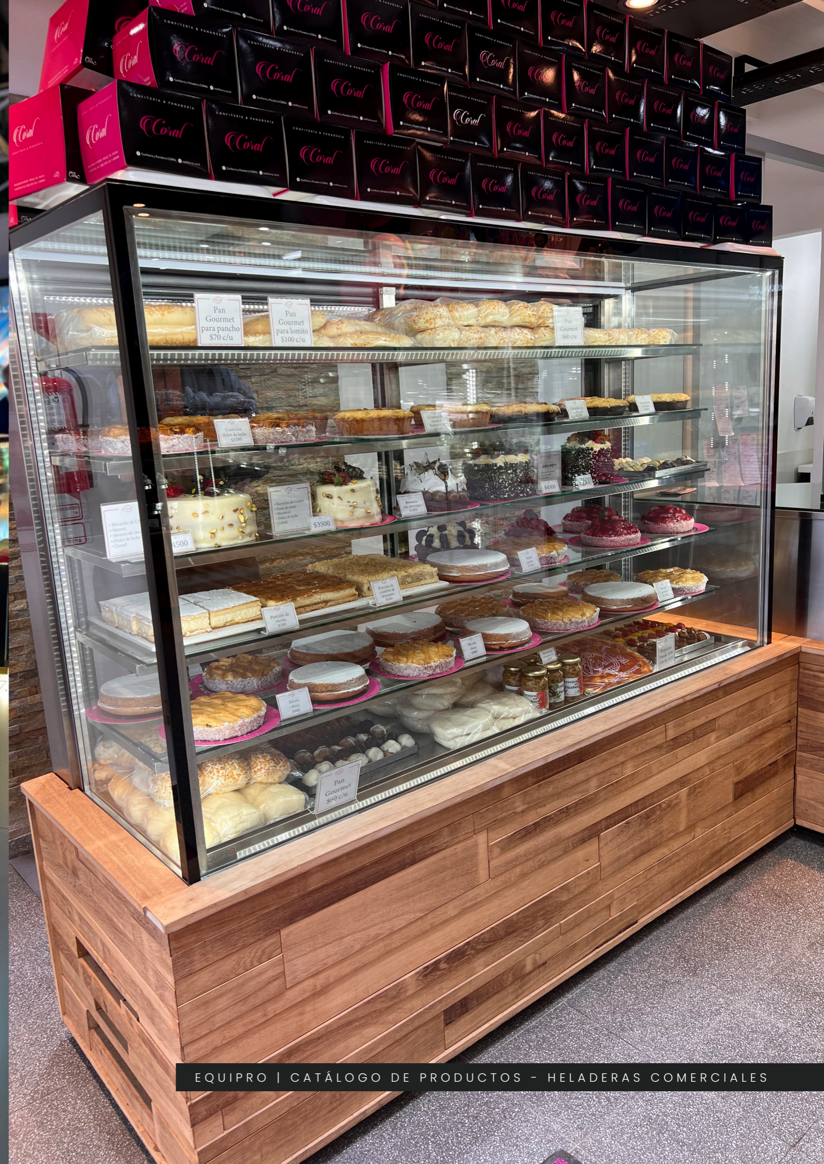
EQUIPRO | CATÁLOGO DE PRODUCTOS - HELADERAS COMERCIALES