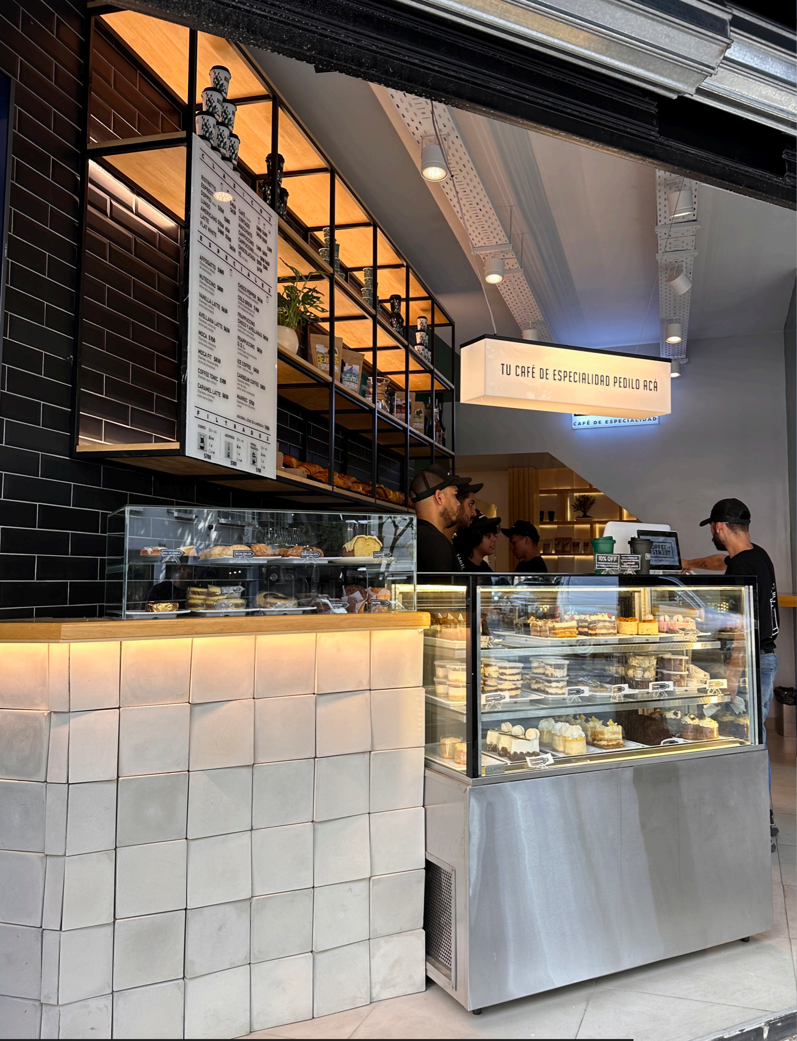
EQUIPRO | CATÁLOGO DE PRODUCTOS - HELADERAS COMERCIALES